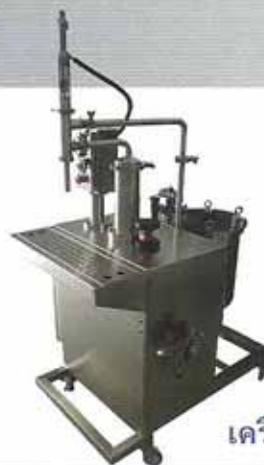
เครื่องบรรจุลูกสูบกึ่งอัตโนมัติ