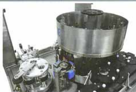
เครื่องปิดฉลากโรตารี