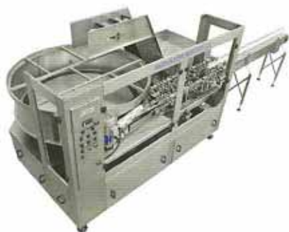
เครื่องตัดขวดอัตโนมัติ