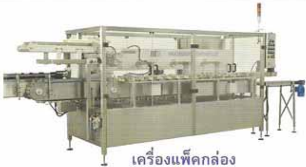
เครื่องแพ็คกล่อง