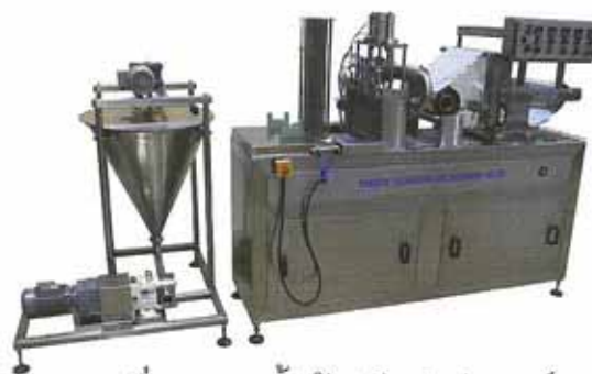
เครื่องบรรจุหน้าถ้วยซีลฝาฟรอยด์