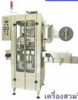
เครื่องสามฟิล์ม