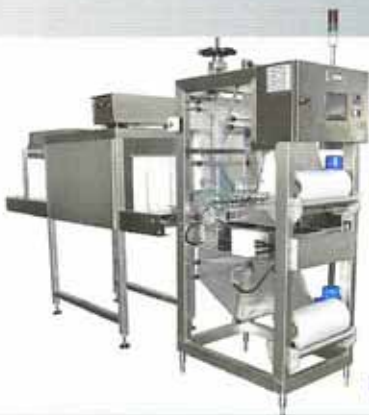
เครื่องห่อแพ็ค+ตู้อบ