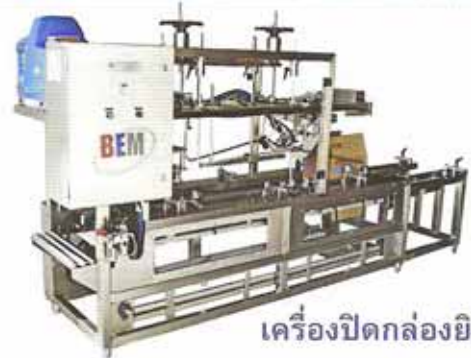
เครื่องปิดกล่องยิงกาวร้อน