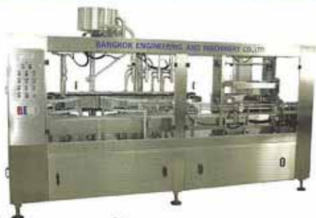
เครื่องล้างบรรจุน้ำถึง 5 ลิตร แบบ INDEXING