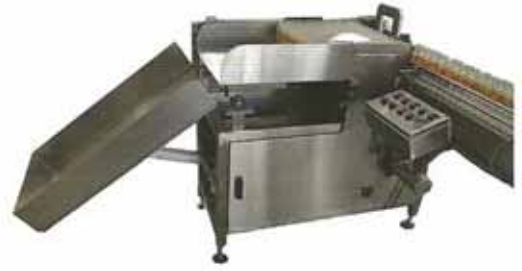
เครื่องตัดขวด PET ใสถุง