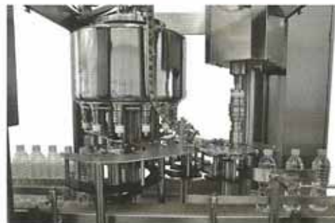
เครื่องบรรจุโรตารี